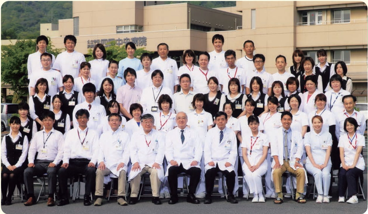
四国中央病院55周年記念 平成26年5月15日

住所: 愛媛県四国中央市川之江町2233番地 TEL(0896)58-3515 FAX(0896)58-3464