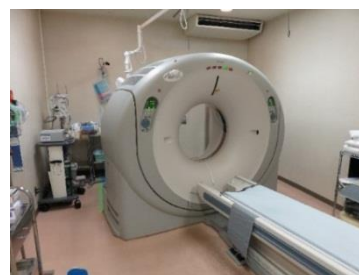
CT (コンピューター断層装置)